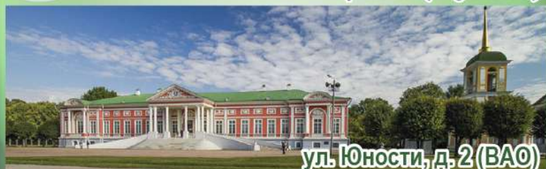
Московский Версаль (Кусково)